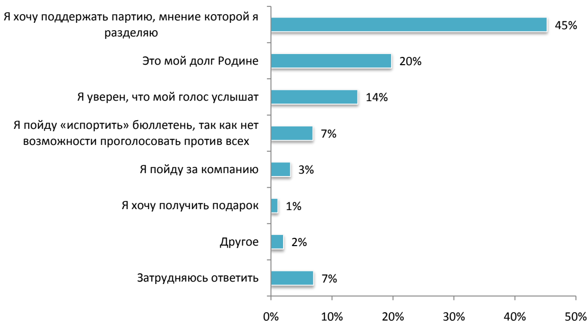
Рис. 3. Скажите, пожалуйста, по какой причине Вы пойдете на предстоящие выборы в Государственную Думу 4 декабря 2011 года?

45% опрошенных собираются пойти на выборы, чтобы поддержать партию, мнение которой они разделяют. Каждый пятый россиянин считает это своим долгом Родине, и 14% всё-таки надеются быть услышанными.