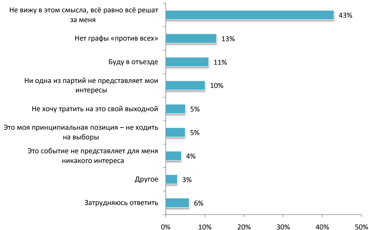
Рис. 2. Скажите, пожалуйста, по какой причине Вы не пойдете на предстоящие выборы в Государственную Думу 4 декабря 2011 года?

45% опрошенных собираются пойти на выборы, чтобы поддержать партию, мнение которой они разделяют. Каждый пятый россиянин считает это своим долгом Родине, и 14% всё-таки надеются быть услышанными.