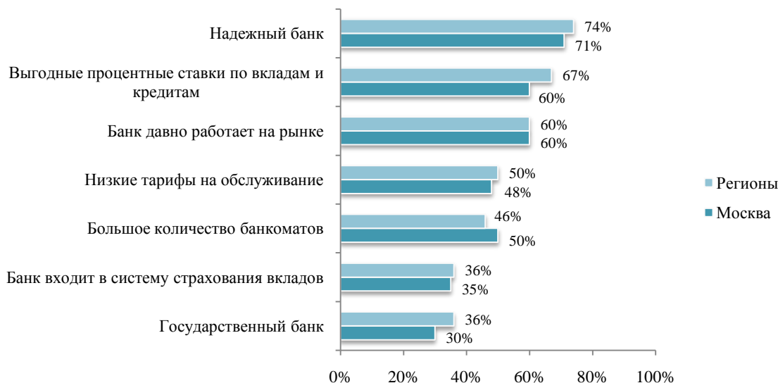
Рис. 2. Какие характеристики являются для Вас основными при принятии решения о выборе банка (распределение в зависимости от места жительства респондентов)? (ТОП-7) 1Q11

Критерии выбора банка с возрастом также меняются, так для людей старше 41 года, более чем другим, оказалось важно, чтобы банк входил в систему страхования вкладов, компетентность и профессионализм персонала. Одновременно такие немаловажные факторы как надежность банка, выгодные процентные ставки по кредитам и вкладам, низкое обслуживание и срок работы банка на рынке оказывают меньше влияния на их выбор.