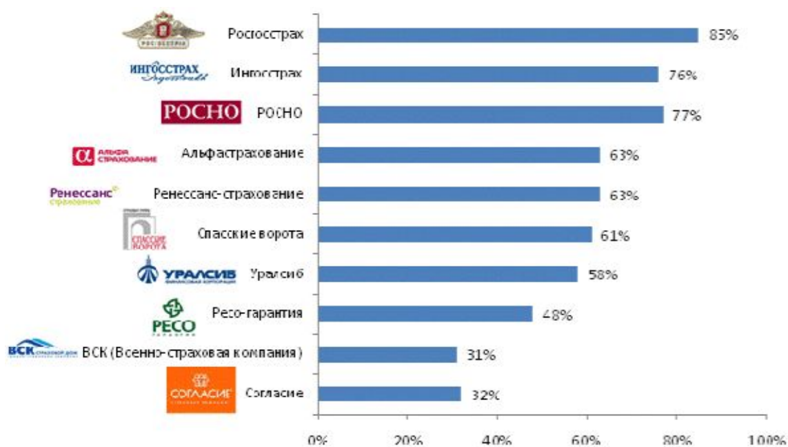
Рис. №2: Знание логотипов страховых компаний с подсказкой

Со знанием логотипов страховщиков дела обстоят несколько иначе. Знание имени той или иной компании и уровень узнавания ее логотипа далеко не всегда совпадают. Так, к примеру, логотип «Ингосстраха» в IV квартале 2009 года, узнали 76% респондентов, в то время как это название этой организации знакомо 89% опрошенных. Компания «Альфастрахование» по итогам года была известна 82%, логотип же организации узнали лишь 63%. Существуют и обратные ситуации. Так, «МСК» известна 28% опрошенных, в то время как ее логотип знает гораздо большее число респондентов – 37%.