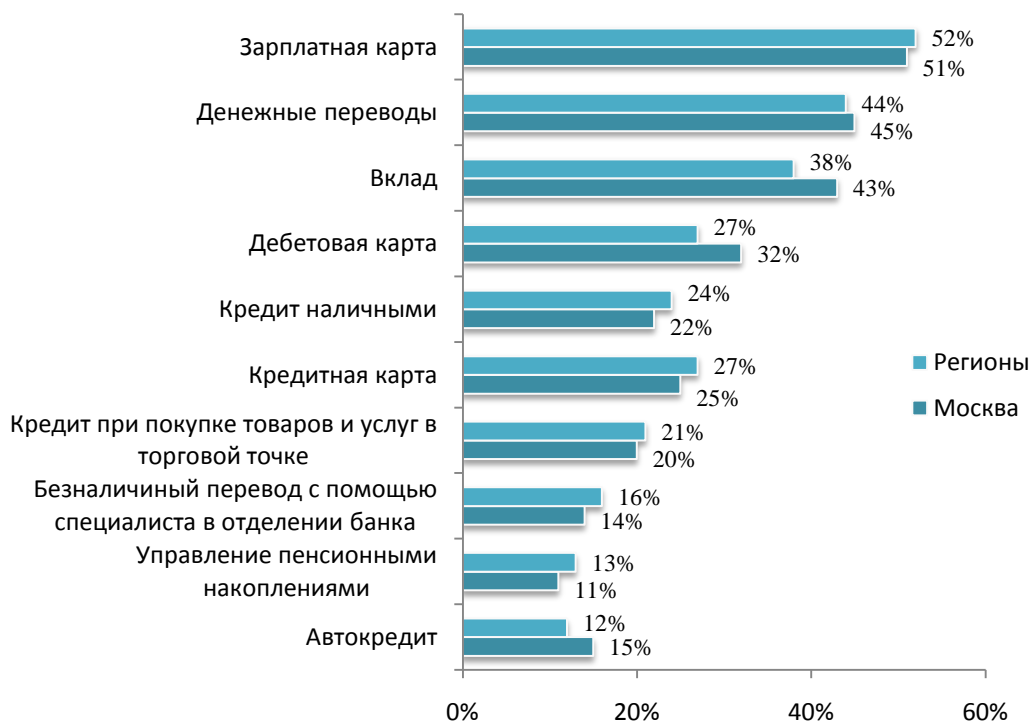
Рис. 2. Какими услугами Вы планируете воспользоваться в ближайшие шесть месяцев (распределение в зависимости от места жительства респондентов)? (ТОП-10) 1Q11

деньги в долг. Помимо кредитов граждане, проживающие в регионах, чаще пользуются безналичным переводом с помощью специалиста в отделении банка. (См. Рис. 2)