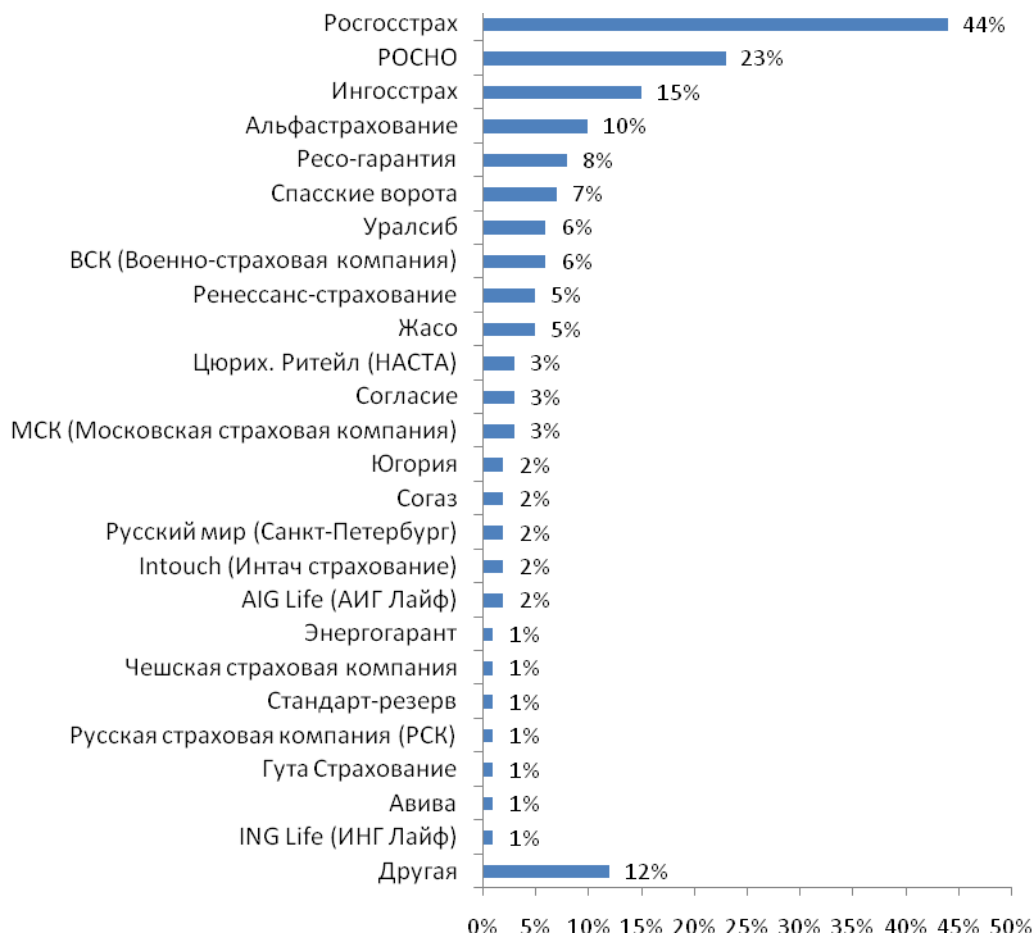
Рис. №1: Текущее пользование услугами страховых компаний

Отметим, что из 44%, указавших, что пользуются услугами «Росгосстраха», 37% считают эту компанию своим основным страховщиком. Из 23% клиентов «РОСНО» привязанность к ней испытывают 13%, которые считают эту компанию своей основной страховой организацией. Относительно «Ингосстраха», из 15% тех, кто прибегает к его услугам, менее половины (6%) считают этого страховщика своим основным. Таким образом, становится понятно, что если человек и оформил страховку в той или иной компании, это вовсе не значит, что у него существует приверженность к ней. И, вероятнее всего, если конкурент предложит более выгодные условия, клиент, не задумываясь, перейдет к нему (см. рис. №2). Более того, 7% участников исследования отметили, что не считают ни одну из компаний, у которой они приобретали страховку, своей основной. Скорее всего, эти люди были вынуждены оформить договор с тем или иным страховщиком не осознанно (приобретали страховку в составе пакета другой услуги). Например, при получении ипотеки или автокредита, банки обязывают заемщиков застраховать кредит и чаще всего предлагают для этого свою страховую компании.