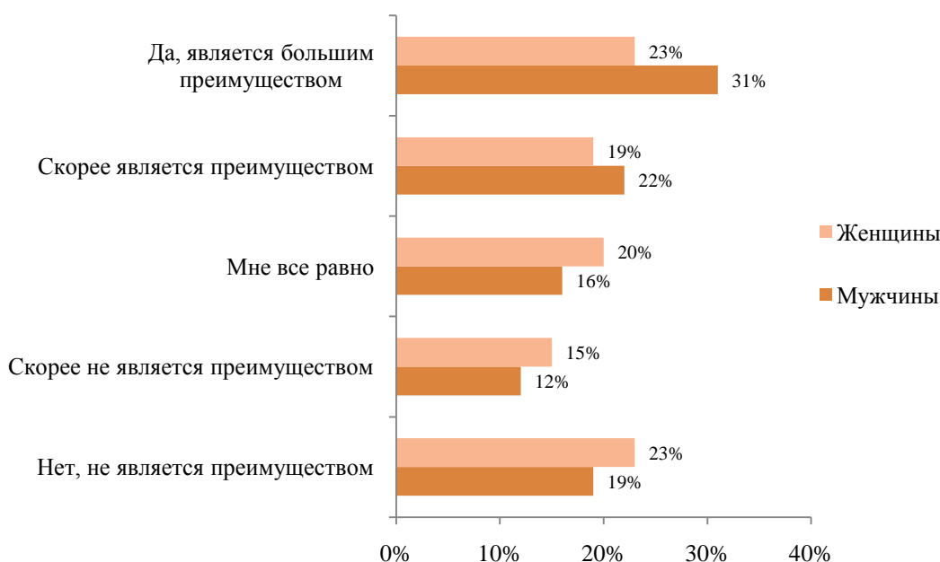
Рис. 1. Является ли интернет-банк конкурентным преимуществом при выборе банка? (распределение по половой принадлежности респондентов)

Анализ данных показал, что доход респондентов оказывает влияние на их отношение к интернет-банку. Так, к примеру, люди с высоким доходом (от 80 000 руб./мес.) считают, что эта услуга является большим преимуществом (38%), менее доходная аудитория (меньше 25 000 руб./мес.) меньше всего обращает внимание на наличие интернет-банка (24%) и не считает это преимуществом для банка (27%) (См. Рис. 2).