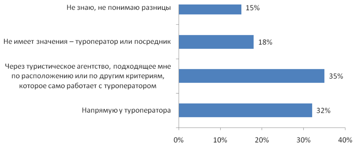
Рис. №2: Как Вы предпочитаете покупать себе путевку: самостоятельно или через посредника? Если через посредника, то через какого?

Однако, даже при наличии возможности самостоятельно покупать билеты и бронировать отели, что может удешевить стоимость отдыха, почти 20% респондентов затруднились ответить, станут ли они прибегать к этому способу. Одновременно с этим, 40% уже подумывают о том, чтобы самостоятельно организовывать свои путешествия. И лишь 13% отметили, что, отправляясь за границу, планируют и организуют свой отдых сами.