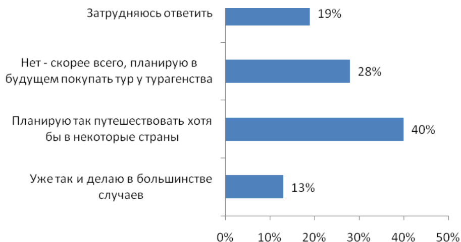
Рис. №3: При поездке за границу Вы самостоятельно покупаете билеты и бронируете отель, не обращаясь в турагентство. Насколько Вам может быть интересна такая схема в будущем?

Немалая часть респондентов (28%) указали, что, все-таки, будут продолжать пользоваться услугами посредников. Видимо, такой параметр как «удобство» играет в их выборе решающую роль: людям не хочется заниматься нервоёмкой и отнимающей много времени бумажной волокитой по оформлению визы, а также поиском и заказом билетов, бронированием отелей, приобретением страховки и др. (см. рис. №3).