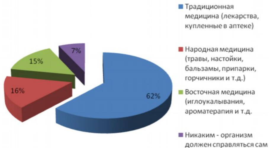
Рис.№4: Каким из перечисленных медицинских подходов Вы доверяете больше всего?

В ходе исследования было выявлено, что россияне довольно внимательно относятся к информации о медицинских препаратах, которые принимают. Более половины респондентов отметили, что при покупке любого лекарства всегда читают инструкцию по применению. Особенное внимание они уделяют разделам о способах применения, дозировке, побочных действиях, взаимодействии с другими препаратами и о передозировке. А около 36% изучают инструкцию, даже если препарат был назначен врачом, который подробно рассказал, как его использовать (см. рис. №5).