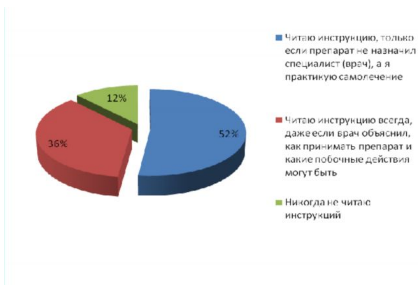
Рис. №5: Как Вы обычно поступаете с инструкциями, вложенными в упаковки с медикаментами?

В ходе исследования было выявлено, что россияне довольно внимательно относятся к информации о медицинских препаратах, которые принимают. Более половины респондентов отметили, что при покупке любого лекарства всегда читают инструкцию по применению. Особенное внимание они уделяют разделам о способах применения, дозировке, побочных действиях, взаимодействии с другими препаратами и о передозировке. А около 36% изучают инструкцию, даже если препарат был назначен врачом, который подробно рассказал, как его использовать (см. рис. №5).