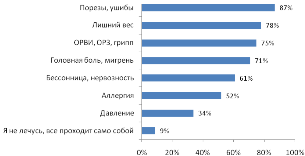
Рис. №2: Какие болезни и состояния Вы обычно лечите самостоятельно, не обращаясь к врачу?

Тем не менее, ведущие позиции в рейтинге лекарств, покупаемых без рекомендации врача, все же занимают безрецептурные препараты. Около 71% без опаски покупают различные средства общего действия и жаропонижающие для лечения простуды, еще 66% приобретают средства от кашля и боли в горле. Третье место разделили препараты от насморка и обезболивающие – ими пользуются порядка 65% участников исследования. К антибиотикам люди относятся несколько осторожнее – самостоятельно решаются принимать их только 21% опрошенных (см. рис. №3).