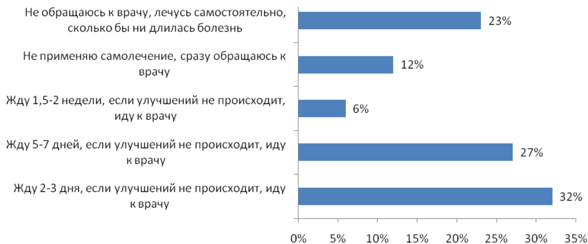
Рис. №6: Сколько времени Вы обычно тратите на самолечение при простуде (ОРВИ, ОРЗ, гриппе), за исключением случаев тяжелого течения?

По сравнению с поликлиниками, аптеки посещаются россиянами значительно чаще. Согласно полученным в ходе исследования данным, половина участников опроса ходят в них, как минимум, 1 раз в месяц (см. рис.№7). Аптека давно стала для наших соотечественников традиционным местом «шопинга» наряду с продуктовыми магазинами, супермаркетами и торговыми центрами. Более того, с расширением аптечного ассортимента, поводов для ознакомления с новыми медицинскими препаратами становится все больше. Так, лишь 5% опрошенных жителей крупных городов вообще не посещают аптечные учреждения, еще 3% делают это максимум раз в год. Конечно, частота посещения аптек у мужской аудитории (особенно в возрасте до 25 лет) значительно ниже.