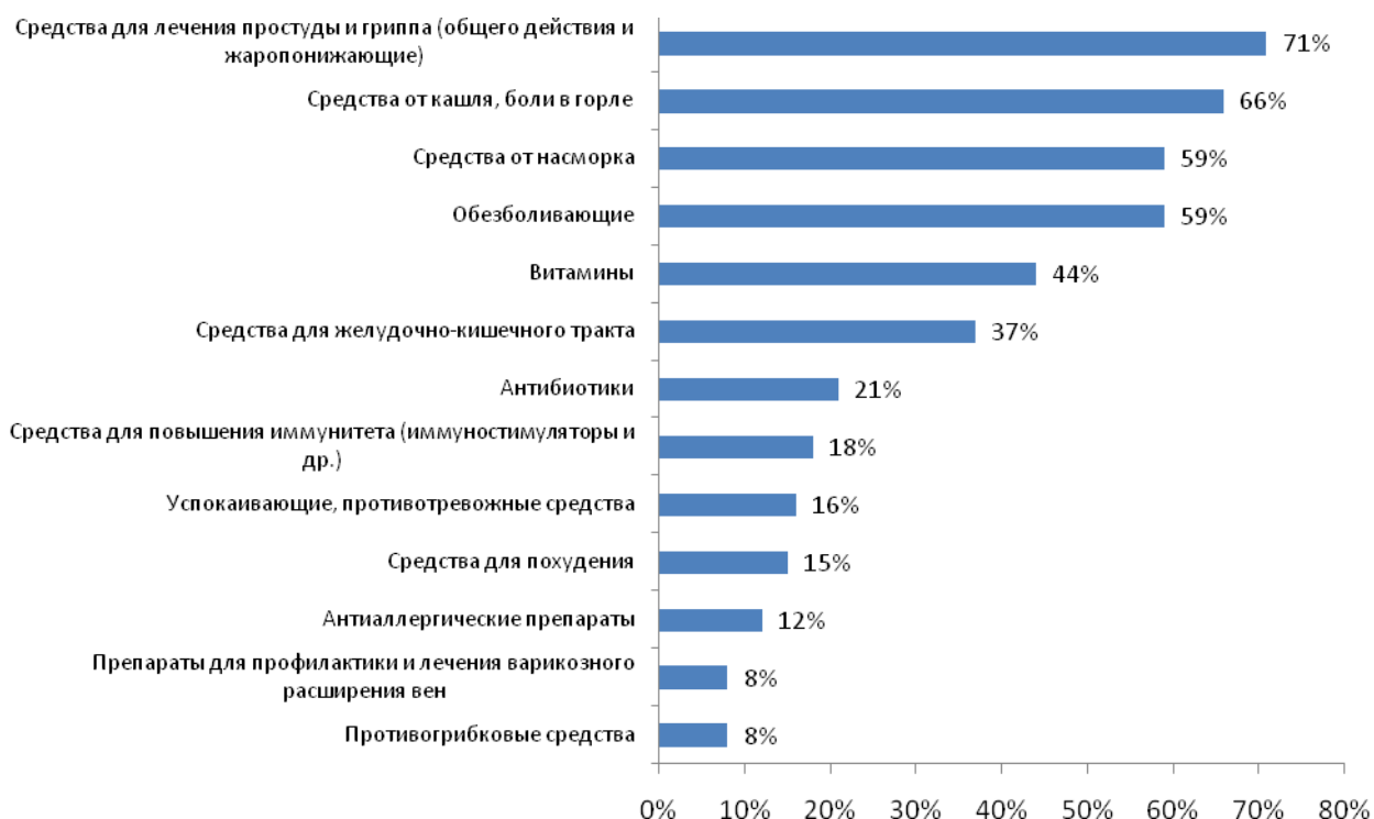
Рис. №3: Какие медицинские препараты Вы обычно принимаете без рекомендации врача?

Тем не менее, ведущие позиции в рейтинге лекарств, покупаемых без рекомендации врача, все же занимают безрецептурные препараты. Около 71% без опаски покупают различные средства общего действия и жаропонижающие для лечения простуды, еще 66% приобретают средства от кашля и боли в горле. Третье место разделили препараты от насморка и обезболивающие – ими пользуются порядка 65% участников исследования. К антибиотикам люди относятся несколько осторожнее – самостоятельно решаются принимать их только 21% опрошенных (см. рис. №3).