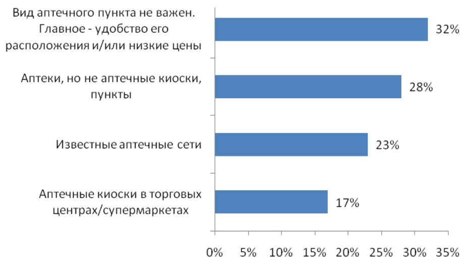
Рис. №8: Какие аптечные учреждения Вы предпочитаете посещать для покупки лекарственных средств?