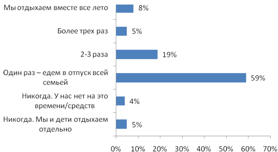
Рис. №2: Как часто Вы ездите отдыхать вместе со своими детьми (ребенком) школьного возраста на срок более 1 недели в течение лета?

Несмотря на разразившийся экономический кризис, ставший причиной финансовых трудностей многих, подавляющее большинство респондентов отметили, что этим летом готовы потратить на досуг своих детей от 20 000 до 30 000 рублей, что является приемлемой суммой для того чтобы отправить ребенка, к примеру, отдохнуть на море. Интересно, что лишь мизерная часть опрошенных (3%) указала, что выделить средства на отдых своим детям не готова. Одновременно с этим не нашлось и много желающих потратить сумму, размер которой превышает 50 000 рублей.