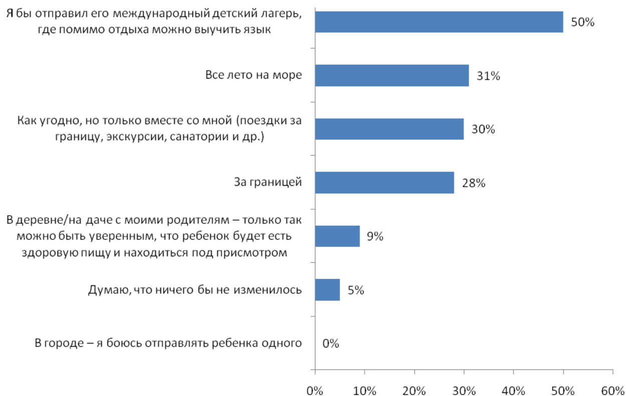
Рис. №6: Если бы ваши финансовые возможности были бы неограниченны, как бы проводили лето ваши дети (ребенок) школьного возраста?

языки. Еще 30% респондентов изъявили желание проводить летом больше времени вместе со своими детьми – вместе путешествовать по разным странам, ездить на экскурсии, в санатории и т.д.