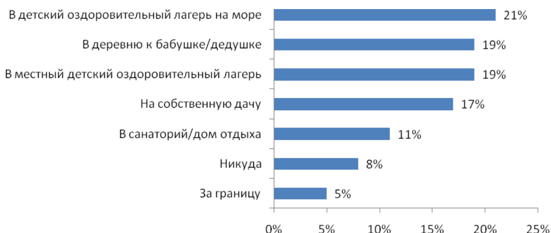
Рис. №1: Куда Вы отправляете летом отдыхать своих детей (ребенка) школьного возраста?

Наиболее пристальное внимание среди участников исследования заслужили в этом году такие места детского отдыха как пионерские лагеря, дачи, деревни. Более половины опрошенных указали, что их чада поедут летом именно туда. Почти 1/5 школьников отправится на море. Лишь 5% отметили, что обеспечат отпрыскам отдых за границей (см. рис. №1).