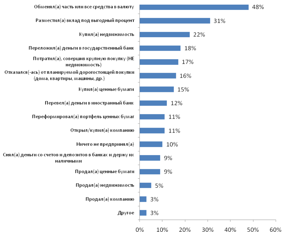
Рис. №1: Что вы предприняли, чтобы застраховать себя от рисков денежных потерь, вызванных финансовым кризисом?

Кризис «расшевелил» тех, кому есть что терять. Лишь 10% от всех опрошенных указали, что никаких действий, направленных на сохранение своего состояния, не предприняли. Почти половина участников исследования указала, что перевели средства в иностранную валюту. Еще порядка трети открыли вклады под выгодные проценты. Однако 18% респондентов отметили, что для перестраховки переложили свои деньги в более надежный банк, имеющий поддержку со стороны государства. Из графика видно, что многие из представителей высокодоходной аудитории приобретают ценные бумаги, недвижимость и др., пока цены на них упали. К примеру, 15% купили бумаги, в то время как избавились от них лишь 9% респондентов. Приобрели недвижимость – 22%, продали – лишь 5%.