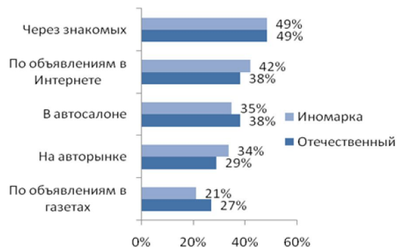
Рис. №1: Какие способы покупки подержанного автомобиля для Вас наиболее приемлемы? Выберите не более 2-х вариантов ответа (на вопрос отвечали те, кто покупал последний раз автомобиль б/у).

Объявлениями в печатных СМИ пользуются все меньшее число людей, поскольку они проигрывают электронным СМИ в скорости размещения информации и получения откликов. Велика и доля тех, кто покупает машины в автосалонах. Скорее всего, эти люди выбирают переплачивать за предоставляемые им гарантии, которые другие посредники дать не могут.