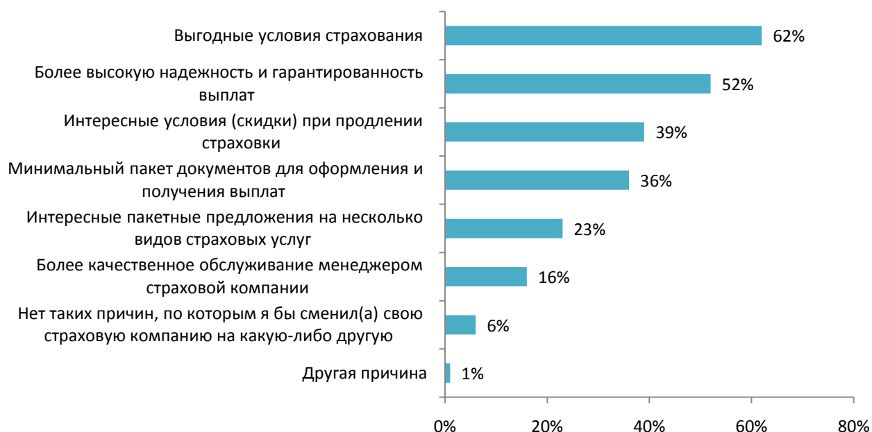
Рис. 1. По каким причинам Вы бы обратились в другую страховую компанию?

Так, 62% безусловно указало на выгодные условия страхования, как на главную причину, которая сможет повлиять на их выбор. Чуть больше половины отметили более высокую надежность и гарантированность выплат. Если 39% предложить более выгодные условия при продлении страховки, они подумают о смене основного страховщика. Стоит обратить внимание, что лишь 6% из всех опрошенных, ни при каких условиях не согласятся сменить свою страховую компанию.