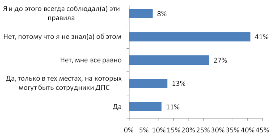
Рис. №1: После того как размер штрафа за переход улицы в неположенном месте увеличился со 100 р. до 200 р. стали ли вы больше соблюдать правила, установленные для пешеходов?

Интересно, что чуть менее половины пешеходов, даже не знали о двукратном увеличении штрафов за нарушение правил перехода дороги. Более четверти, несмотря на то, что были осведомлены об этом, отметили, что в своих привычках ничего не поменяли и больше соблюдать правила не стали. Еще 13% сказали, что теперь более аккуратно стали переходить дорогу только в тех местах, где есть вероятность быть замеченными сотрудниками ДПС. И только один из десяти опрошенных все-таки стал более внимательно относиться к соблюдению правил перехода дороги (см. рис.№1).