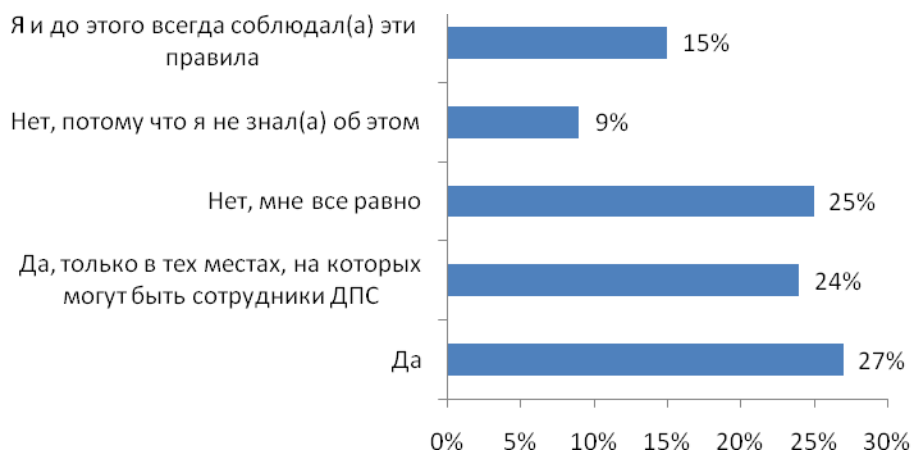
Рис. №2: После того, как штраф для водителей за то, что они не уступают дорогу пешеходам, был увеличен со 100 р. до 1000 р. стали ли вы уступать дорогу пешеходам?

лишь 9% отметили, что ничего не знали о нововведении (см. рис. №2). Для сравнения, пешеходов, которые не в курсе событий оказалось почти в 5 раз больше.