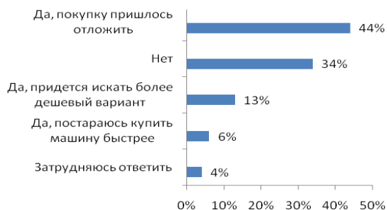
Рис. №3: Повлиял ли финансовый кризис на Ваши планы поменять машину (отвечали только те, кто отметил, что планирует сменить авто)?

Однако, финансовый кризис все-таки стал причиной того, что почти половина участников исследования была вынуждена отложить смену машины. В целом же, кризис оказал влияние на 2/3 участников исследования, планировавших сменить авто. Однако, стоит также отметить, что на задумки еще 1/3 опрошенных он влияния не оказал (см. рис. №3).