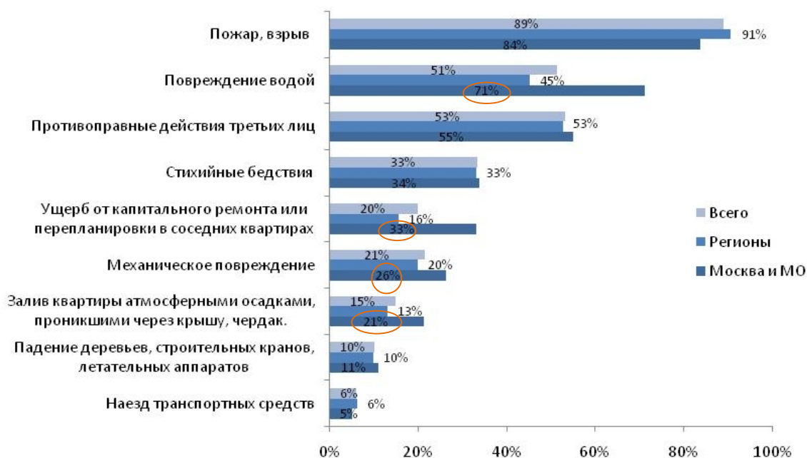
Рис.№2.1: От каких рисков Вы застраховали свое имущество (разбивка по географии проживания респондентов)?

Анализ данных показал, что, прибегая к услуге по страхованию имущества, люди стараются защитить свою собственность, в первую очередь, от таких рисков как: пожары/взрывы (89%), повреждения водой (51%) и противоправные действия третьих лиц (53%). Причем если в регионах люди больше всего боятся пожаров и взрывов (91% против 84%), то москвичей пугает более широкий спектр неприятностей. Например, повреждения водой (71% в столице против 45% в регионах), ущерб от ремонта/перепланировки, проводимых соседями (33% против 16% соответственно), механические повреждения (26% против 20% соответственно), заливы квартир осадками (21% против 13%) и проч. (см. рис.№2.1).