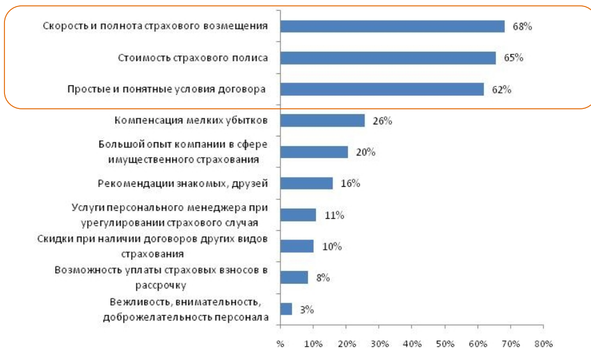
Рис. №3: Если Вы решите приобрести полис страхования имущества, какие основные параметры Вы будете учитывать при выборе страховой компании?