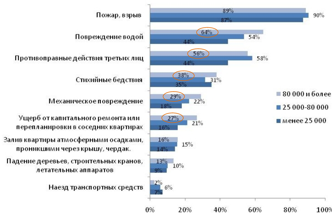
Рис.№2.3: От каких рисков Вы застраховали свое имущество (разбивка по доходу респондентов)?

Полученные данные свидетельствуют, что высокодоходная часть респондентов чаще страхует имущество, от таких рисков как повреждения водой, противоправные действия третьих лиц, механические повреждения и проч. (см. рис. №2.3).