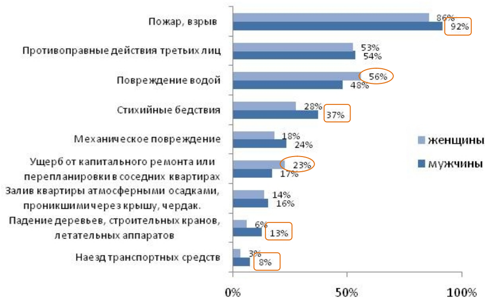
Рис.№2.2: От каких рисков Вы застраховали свое имущество (разбивка по полу респондентов)?

Полученные данные свидетельствуют, что высокодоходная часть респондентов чаще страхует имущество, от таких рисков как повреждения водой, противоправные действия третьих лиц, механические повреждения и проч. (см. рис. №2.3).