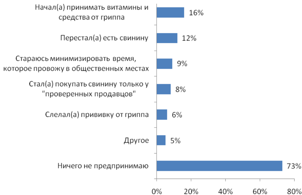
Рис.№2: Предпринимаете ли Вы какие-то действия, чтобы обезопасить себя и своих близких от свиного гриппа? В добавление ко всем вышеприведенным фактам, отметим, что среди участников исследования, знающих о существовании угрозы свиного гриппа, только 17% смогли указать его верное медицинское название – вирус А/Н1N1. Многие респонденты, в попытках угадать, как же «зывается» этот недуг, сделали предположения, которые оказались неверны. Основная же масса (61%) указали, что названия не помнит (см. рис.№3).

вирус через мясо не передается (см. рис.№2). Так что вскоре стоит ожидать, что потребление свинины вернется на прежний уровень.