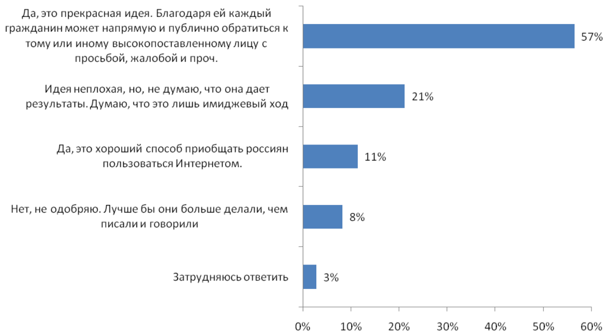
Рис. №1: Собственный блог ведет и Президент России Дмитрий Медведев, и председатель Совета Федерации Сергей Миронов и ряд других государственных и политических деятелей России. Одобряете ли Вы такую форму общения «сильных мира сего» с народом?

Несмотря на то, что больше половины блоггеров положительно относятся к сетевому общению с политиками, 51% предпочитают сетевые журналы, которые находятся «вне политики», что свидетельствует о низкой политической активности блогосферы. Среди тех, кого интересует политическая тематика, 61% периодически посещают блог Президента РФ и просматривают записи, которые в нем появляются (см. рис. №2).