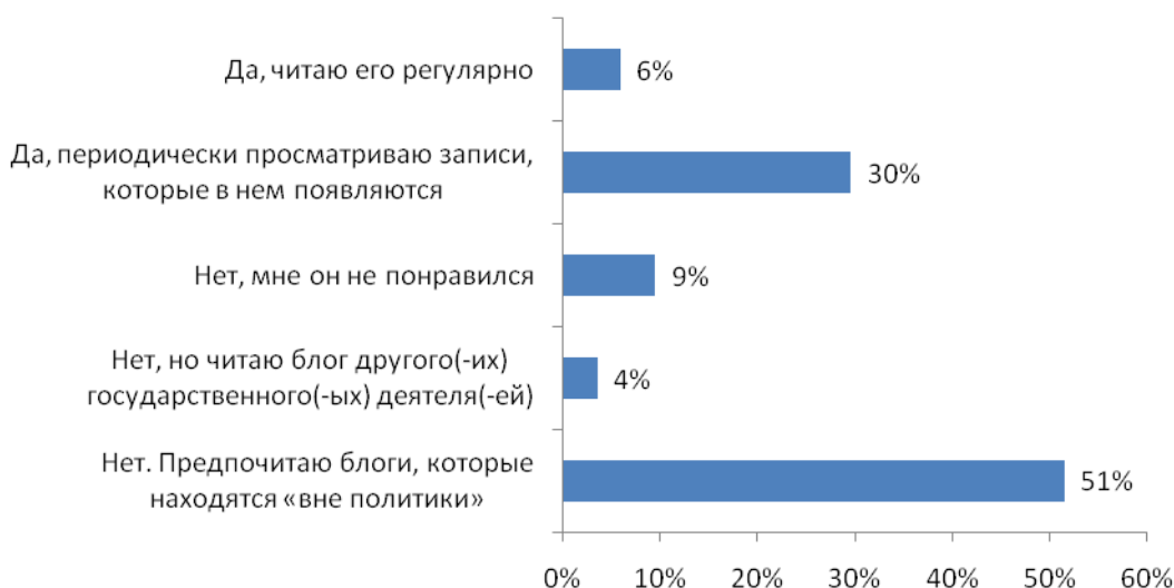
Рис. №2: Являетесь ли Вы читателем блога Президента РФ Дмитрия Медведева?

Несмотря на то, что больше половины блоггеров положительно относятся к сетевому общению с политиками, 51% предпочитают сетевые журналы, которые находятся «вне политики», что свидетельствует о низкой политической активности блогосферы. Среди тех, кого интересует политическая тематика, 61% периодически посещают блог Президента РФ и просматривают записи, которые в нем появляются (см. рис. №2).