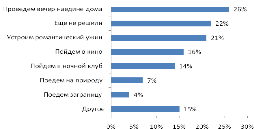
Рис. №5: Как вы планируете отметить День Святого Валентина?

Как показало исследование, у россиян вошло в привычку поздравлять друг друга с 14 февраля не только, с помощью подарков и приятных сюрпризов. Многие в этот день приглашают своих любимых в кино (16%), ночные клубы (14%), для некоторых 14 февраля - повод освободиться пораньше, чтобы провести время наедине с любимым человеком (26%), устроить, например, романтический ужин (21%). Видимо, для русского народа праздник влюбленных стал днем, когда люди могут отстраниться от суеты повседневной жизни и напомнить тому, кто находится рядом, что он ценен, важен и любим. Однако, несмотря на всю значимость 14 февраля, многие россияне не планируют этот день заблаговременно. Об этом свидетельствуют данные, полученные в ходе исследования: 22% респондентов до сих пор не определились, как будут отмечать праздник (см. рис. №5).