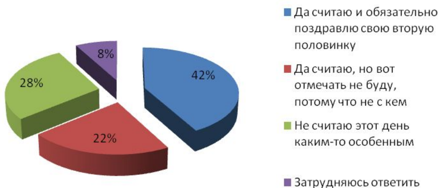
Рис.№3: Считаете ли вы День Святого Валентина праздником, собираетесь ли вы его отмечать?

Для многих же молодых россиян этот праздник стал важным событием. К примеру, порядка 42% намерены в этом году поздравлять свою вторую половинку. Еще 22% сказали, что с удовольствием бы отметили этот день с любимым человеком, но, к сожалению, такого пока нет (см. рис.№3).