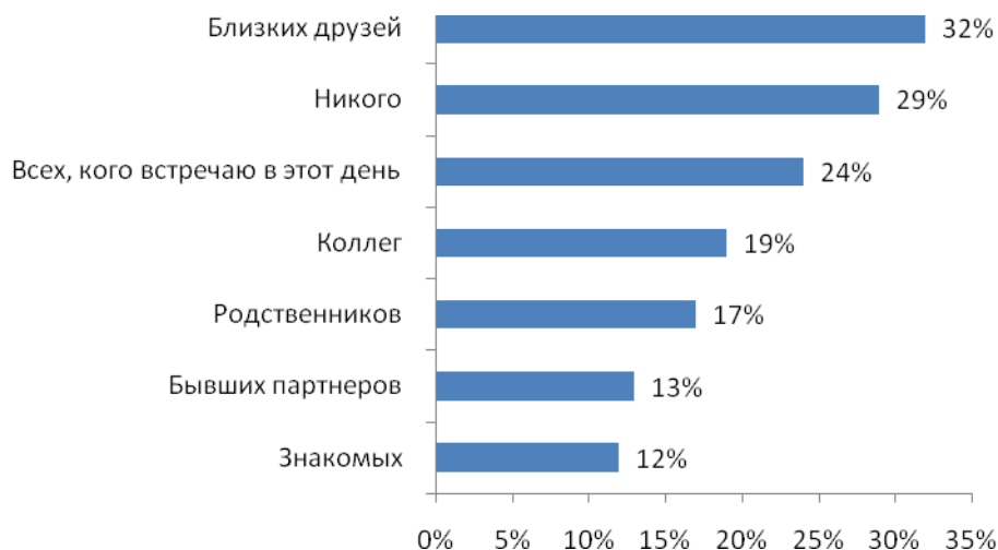
Рис. №7: Кого, помимо своего любимого человека, вы поздравляете с 14 февраля?

Интересен и тот факт, что многие россияне в этот день признаются в любви не только своим вторым половинкам, но и другим дорогим им людям. Так, например, 32% отметили, что поздравляют своих близких друзей (32%), родственников (17%), коллег (19%) и др. Однако, в этом году 29% жителей крупных городов России не планируют поздравлять кого-либо с праздником любви (см. рис. №7).