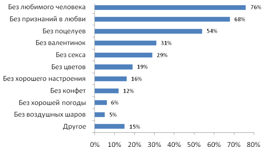
Рис. №6: Без чего вы не можете представить День всех влюбленных?

соотечественников дарит и получает в этот день любовные послания в виде небольших открыток (см. рис. №6).