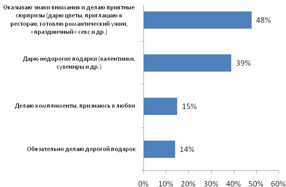
Рис. №4: Как вы поздравляете своего любимого человека с Днем Святого Валентина?

Как показало исследование, у россиян вошло в привычку поздравлять друг друга с 14 февраля не только, с помощью подарков и приятных сюрпризов. Многие в этот день приглашают своих любимых в кино (16%), ночные клубы (14%), для некоторых 14 февраля - повод освободиться пораньше, чтобы провести время наедине с любимым человеком (26%), устроить, например, романтический ужин (21%). Видимо, для русского народа праздник влюбленных стал днем, когда люди могут отстраниться от суеты повседневной жизни и напомнить тому, кто находится рядом, что он ценен, важен и любим. Однако, несмотря на всю значимость 14 февраля, многие россияне не планируют этот день заблаговременно. Об этом свидетельствуют данные, полученные в ходе исследования: 22% респондентов до сих пор не определились, как будут отмечать праздник (см. рис. №5).