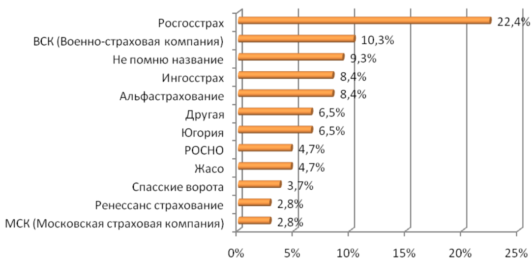
Рис. 2. В какой страховой компании у Вас оформлен договор ипотечного страхования? (ТОП-10 самых популярных компаний)

В настоящее время все больше банков начали предоставлять услуги ипотечного кредитования, это можно объяснить выходом страны из кризисной ситуации. На данный момент, очевидно, что респонденты отдают свои предпочтения надежным и проверенным временем компаниям.