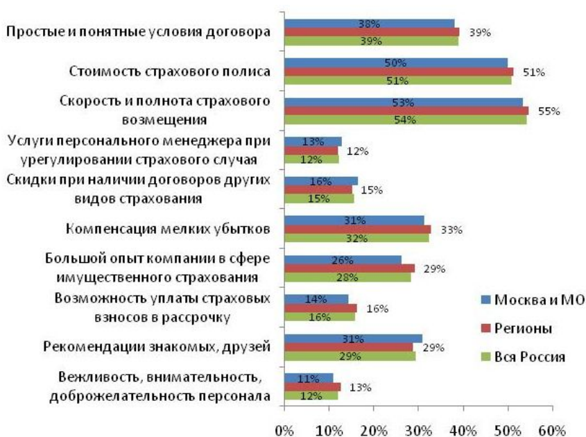
Рис.№3: Если Вы решите приобрести полис страхования имущества, какие основные параметры Вы будете учитывать при выборе страховой компании?

Какие факторы наиболее важны для участников исследования при выборе страховщика? Более половины опрошенных указали на стоимость страховки, а также на скорость и полноту возмещения ущерба в случае наступления страхового случая. Еще около трети отметили, что для них важна простота и доступности изложения условий договора и возможность получения компенсации за мелкие убытки (см. рис. №3). Таким образом, можно сделать вывод, что решающую роль в выборе страховщика играет цена на услугу, в то время как репутация и опыт работы компании отходят на дальний план.