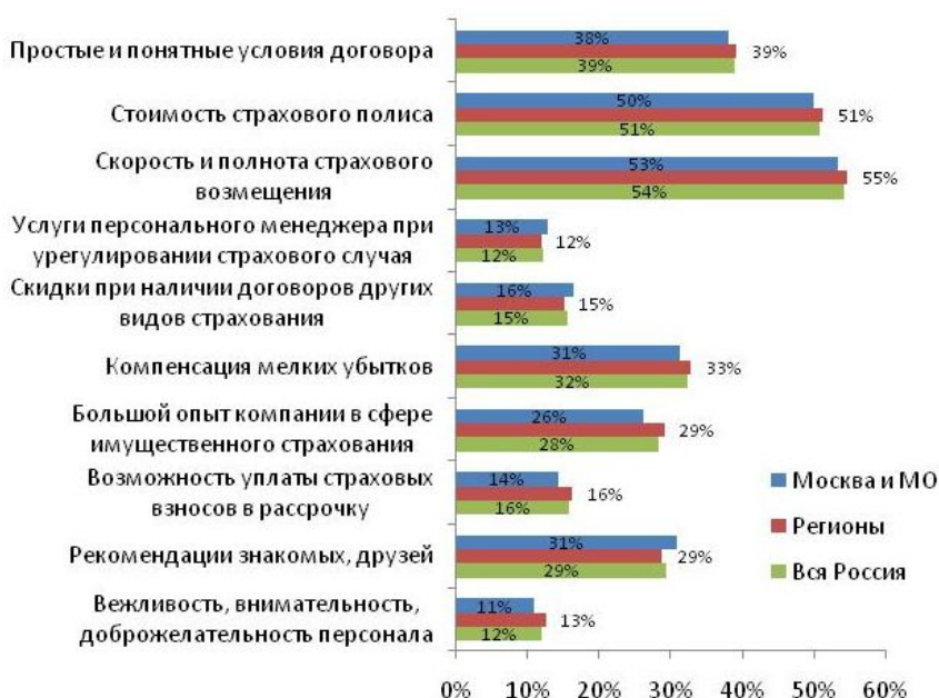
Рис.№3: Если Вы решите приобрести полис страхования имущества, какие основные параметры Вы будете учитывать при выборе страховой компании?

Какие факторы наиболее важны для участников исследования при выборе страховщика? Более половины опрошенных указали на стоимость страховки, а также на скорость и полноту возмещения ущерба в случае наступления страхового случая. Еще около трети отметили, что для них важна простота и доступности изложения условий договора и возможность получения компенсации за мелкие убытки (см. рис. №3). Таким образом, можно сделать вывод, что решающую роль в выборе страховщика играет цена на услугу, в то время как репутация и опыт работы компании отходят на дальний план.