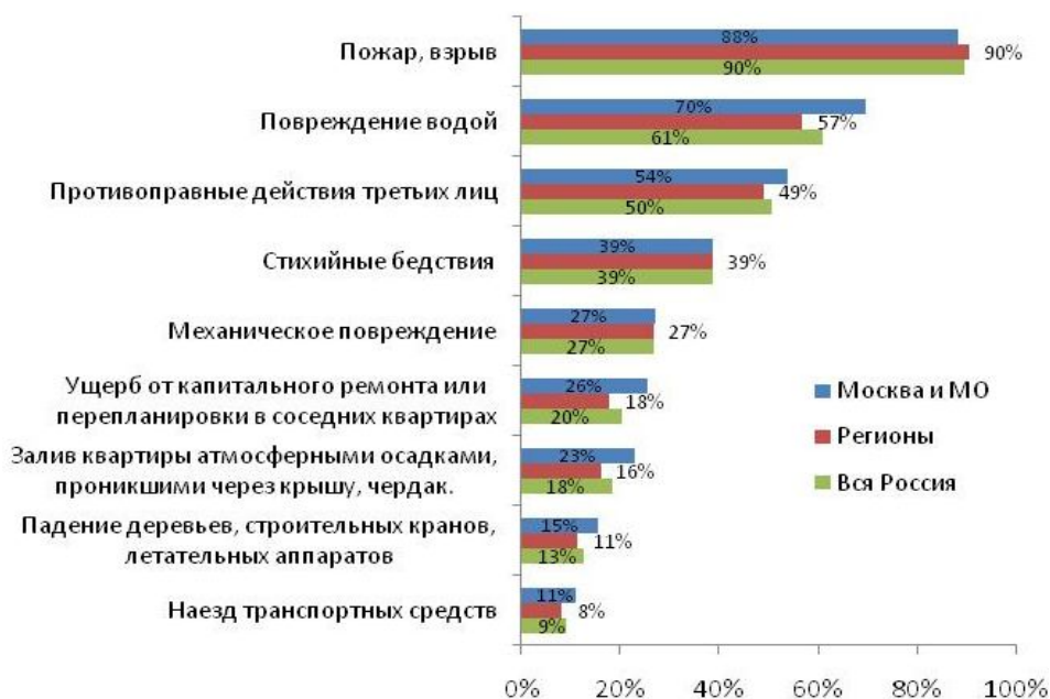
Рис.№2: От каких рисков Вы застраховали свое имущество?

Исследование также показало, что москвичей, страхующих имущество от повреждения водой, залива квартиры осадками через крышу и чердак, а также от капитального ремонта или перепланировки в соседних квартирах, оказалось несколько больше, чем жителей регионов (см. рис. №2).