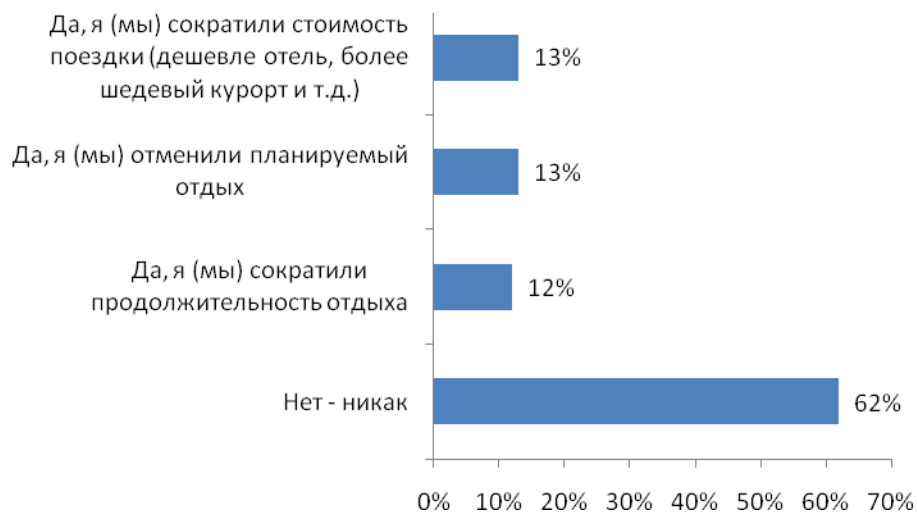
Рис. №3: Изменились ли в связи с кризисом Ваши планы на предстоящие майские праздники?