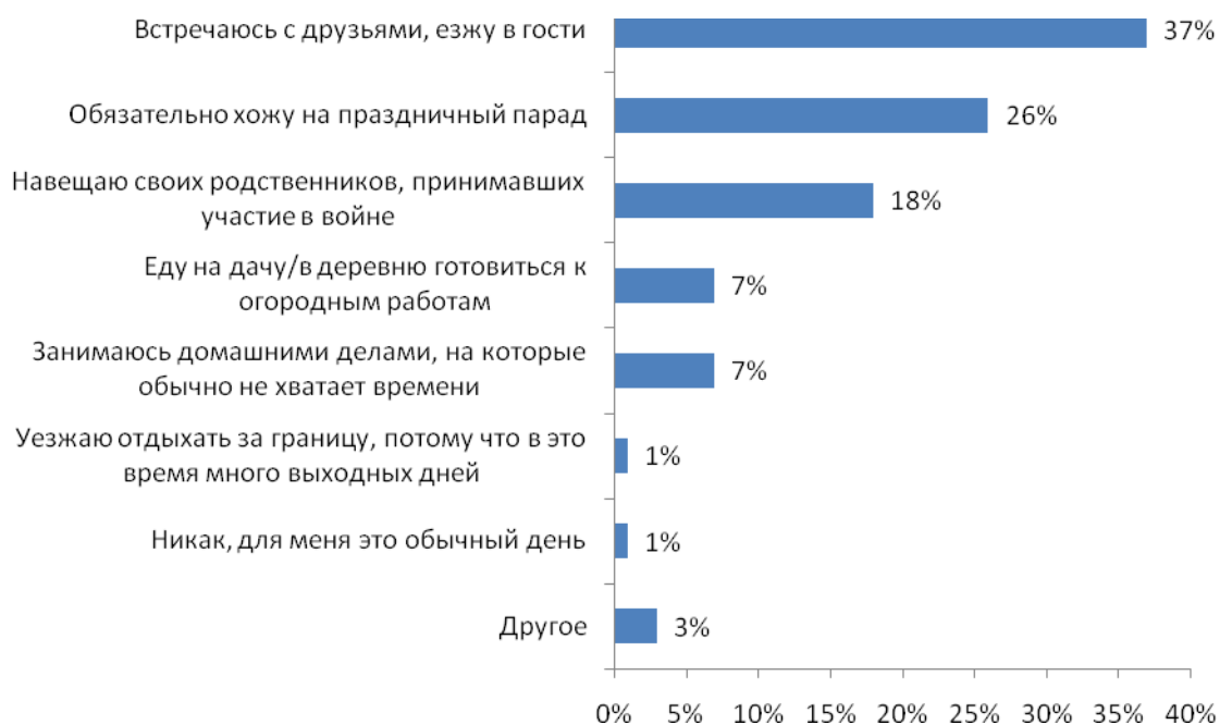
Рис. №2: Как Вы обычно отмечаете 9 мая?

Всем известен факт, что майские праздники в последние годы стали для россиян периодом отпусков: днями, в которые люди готовы забыть о работе и, после зимних холодов отправиться куда-нибудь за границу - поближе к морю и солнцу. У людей, размер ежемесячного дохода которых можно оценить как выше среднего и высокий, стало традицией выезжать в это время за рубеж. «Мы решили выяснить, стал ли финансовый кризис причиной, по которой люди вынуждены менять свои планы, - рассказывает директор по развитию Profi Online Research Елена Смирнова. – Могут ли они сейчас позволить себе отправиться за границу». Выяснилось, что кризису никаким образом не удалось нарушить планы большей части состоятельных граждан: порядка 62% отметили, что будут действовать согласно своим замыслам. Однако, оставшаяся часть респондентов, которая составила более 1/3 от всех, кому был задан данный вопрос, признались, что экономический кризис вынудил их «подтянуть ремни»: сократить время отпуска или выбрать более дешевую страну, а 13% участников исследования пришлось вовсе отказаться от задуманной поездки (см. рис. №3).