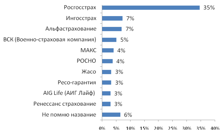
Рис. №1: В какой компании у Вас оформлена программа страхования жизни (ТОП-10 самых популярных компаний, присутствовавших в ответах респондентов)?

Второе место по степени реализации предложений по страхованию жизни разделили «Ингосстрах» и «Альфастрахование». Их услугами воспользовалось 14% опрошенных (по 7% в каждой). Третье место отошло компании «ВСК» (5% соответственно) – см. рис. №1. Таким образом, на 4 лидирующих страховых компании приходится чуть более половины застрахованных в сегменте страхования жизни.