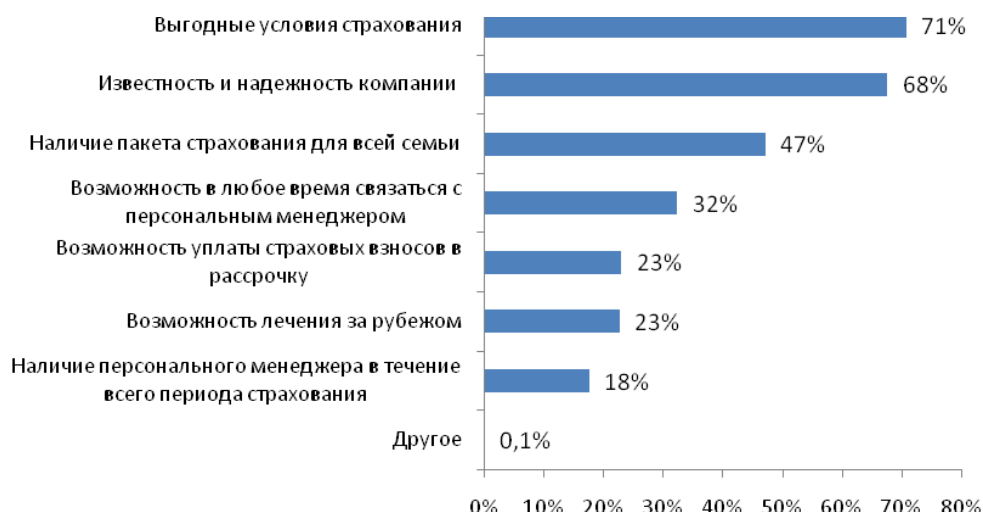
Рис. №4: Если Вы решите застраховать свою жизнь или жизнь своих близких, какие основные параметры Вы будете учитывать при выборе компании? Выберите не более 3 ответов.

Какими предложениями страховых организаций могут заинтересоваться клиенты, желающие застраховать свою жизнь или жизнь своих близких? Выяснилось, что большинство ищет выгодные условия страхования (71%), еще 68% смотрят на степень известности и надежности компании. Анализ данных показывает, что роль имиджа компании за последний год несколько возросла. Вероятнее всего, это связано с финансовым кризисом, который заставил клиентов более щепетильно подходить к выбору обслуживающей организации. Также половина опрошенных заинтересована в том, чтобы страховщик предлагал не только страхование жизни отдельных лиц, но и пакеты для всех членов семьи (см. рис. №4).